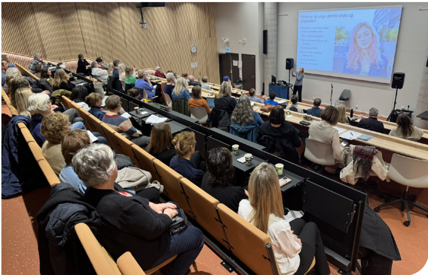
Nærmere 160 mennesker deltok på årets Diakonikonferanse.

– Det er likevel slik i Norge at vi har en lav andel unge utenfor skole og arbeidsliv, sa Fyhn.