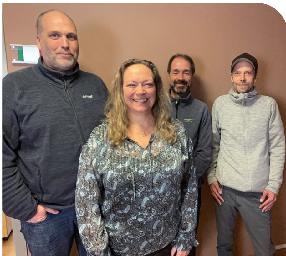
Medarbeidere ved Folkeuniversitetets fagskole i Bergen har kontor i Regines gjestehus på Haraldsplass.

– Vi har et svært langsiktig perspektiv. I første omgang er det viktig for oss nye eiere å sikre både kontinuitet og grunnlag for nødvendige endringer som oppkjøpet fører med seg, fortsetter han.